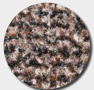
Fibres grattantes + absorbantes mouchetées