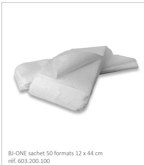
BJ-ONE sachet 50 formats 12 x 44 cm réf. 603.200.100