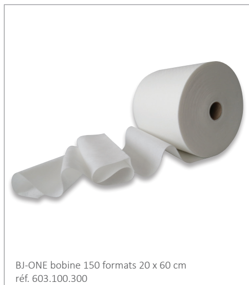
BJ-ONE bobine 150 formats 20 x 60 cm réf. 603.100.300