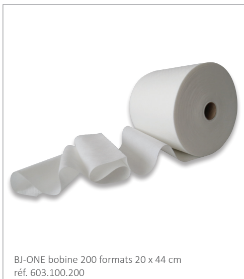
BJ-ONE bobine 200 formats 20 x 44 cm réf. 603.100.200