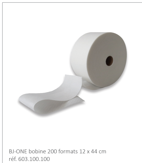
BJ-ONE bobine 200 formats 12 x 44 cm réf. 603.100.100