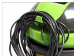
CROCHET POUR CÂBLE