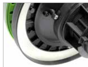
JOINT DE TÊTE NOVATEUR