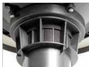
SYSTÈME ANTI-MOUSSE INTÉGRÉ